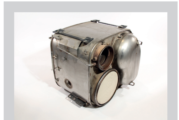
Katalysator- /DPF-Box Reinigungsmodul, DPF mit Oxi- und SCR-Kat Prüfung, Reinigung, Fracht auf Anfrage