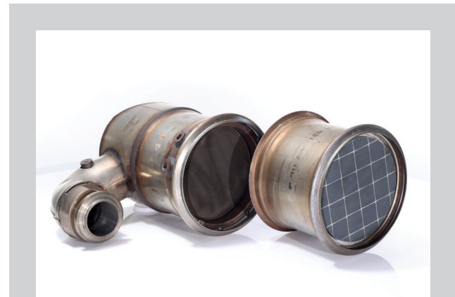
Filterpatrone incl. Katalysator Kombination DPF mit Oxi- oder SCR-Kat All inclusive: Prüfung, Reinigung, Fracht max. 25 kg, Expressdienst