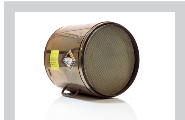
Filterpatrone Partikelfiltereinsatz All inclusive: Prüfung, Reinigung, Fracht max. 25 kg, Expressdienst